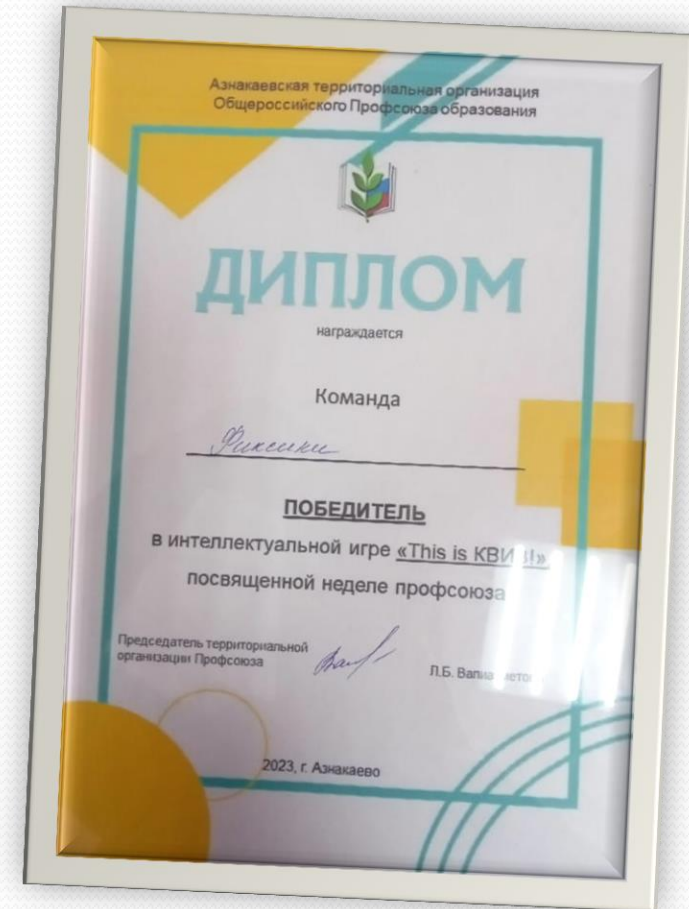
ПОБЕДИТЕЛЬ Муниципальная интеллектуальная игра «This is KVI3!»